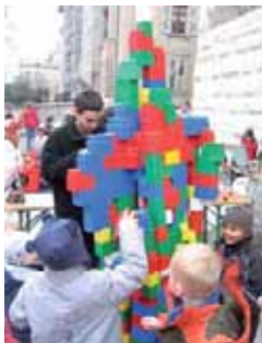
Jeu géant à la fête de la feuille.