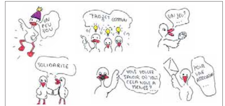
Le jeu de la solidarité ou l'histoire d'un oeuf devenu aussi gros qu'un boeuf.

Voilà une belle histoire que celle de ces jeunes entre 11 et 15 ans, placés en foyer suite à des problèmes familiaux ou personnels. Un jour, les animateurs leurs demandent de réfléchir à ce que chacun peut apporter aux autres. L'idée est de leur permettre de trouver la confiance et l'estime de soi suffisantes pour se persuader qu'ils ont quelque chose à apporter à autrui. Untel sait cuisiner un plat exotique, un autre sait jouer au badminton... Les jeunes imaginent alors un jeu de loie où chacun, à tour de rôle, doit trouver ce qu'il peut apporter à la personne désignée. Une initiative basée sur la solidarité, que les jeunes du Grand-Saconnex vous présente-