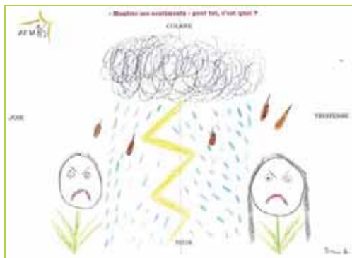
Les dessins révèlent souvent des non-dits et des sentiments cachés.

Parce qu'il est parfois difficile de parler de ses préoccupations, l'Association des Familles Monoparentales invite tous les parents et enfants à venir s'exprimer de façon créative.