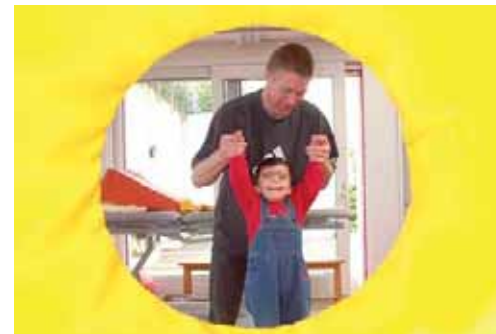
La Fondation Clair Bois accueille les personnes polyhandicapées au sein d'écoles et de homes spécialisés.

Une rencontre dans la création, l'expérimentation et le dépassement de soi avec la Fondation Clair Bois.