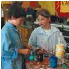
Création d'arbre généalogique avec l'atelier des Bricolages.

L'association Païdos est un lieu d'accueil pour les adolescents en rupture de formation et nécessitant une prise en charge psychopédagogique.